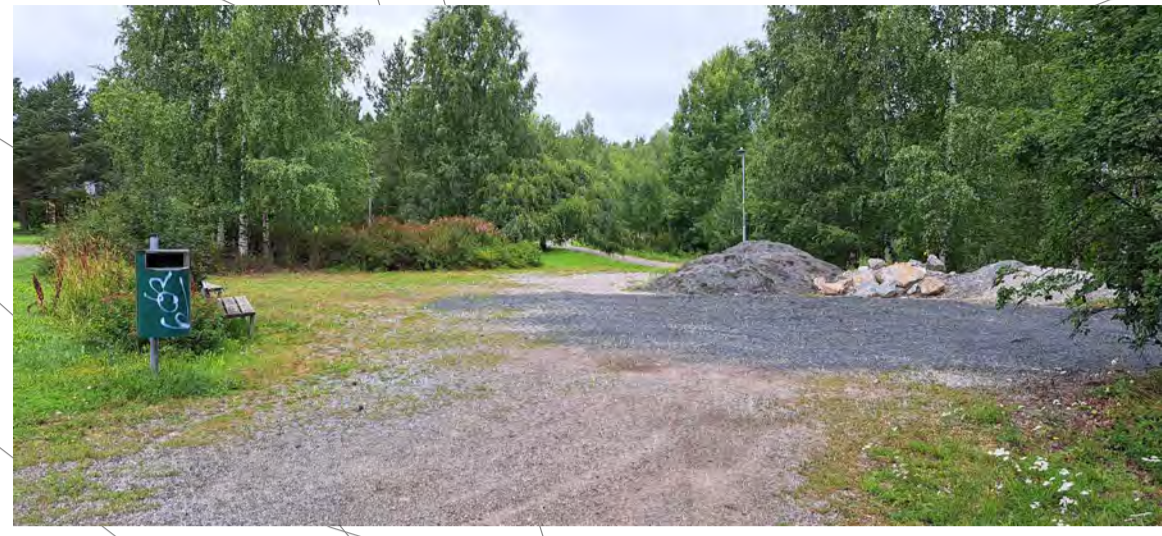
Kohteessa on ollut aiemmin minigolfrata ja pensaiden takana pieni leikkipaikka. Aluetta on käytetty kiviainesten varastoalueena.